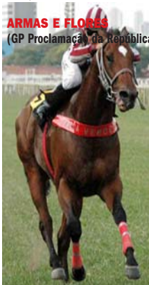
ARMAS E FLORES (GP Proclamação da República - G2),

O lote 28, ESPECTRO SOLAR (ARG), potro ganhador em C. Jardim, filho de Our Emblema na velocista clássica TODAS AS FLORES (GP Independência - G3), por Roi Normand . Da mesma família dos ganhadores clássicos ELETRO NUCEAR (GP Independência - G3), CORES DO CÉU (Clás. Erasmo T. de Assumpção - L) e