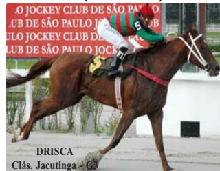
DRISCA Clás. Jacutinga - G3

EBONY JEWEL , lote 20, filho de Yagli (Jet, Royal Home - recordista) em Ibope por Beyton . Potranca 3 anos, ganhadora de 2 corridas na grama e areia. Irmã materna de DRISCA (Clás Jacutinga - G3). Sua mãe, a clássica Ibope é irmã materna de AMOR POR INTEIRO (GP ABCCC - G1).